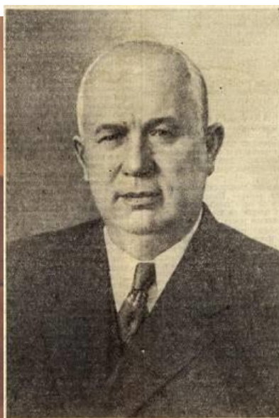
Берия Л. П. – первый заместитель председателя Совета Министров СССР Министр внутренних дел СССР.